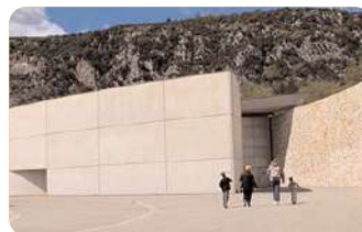
Musée de préhistoire Quinson

Un lieu culturel dédié à la vie et l'œuvre de Jean Giono dans sa ville natale.