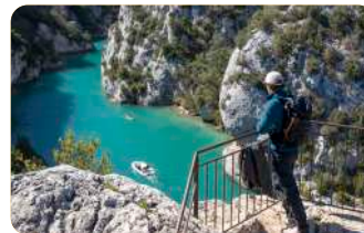
Gorges du Verdon