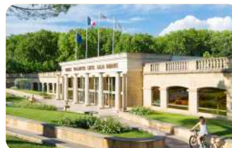
Cure thermale Gréoux-les-Bains

Vieux village typique de Haute Provence qu'il faut visiter à pied en flanant le long de ses ruelles étroites pour découvrir des maisons anciennes restaurées avec charme.