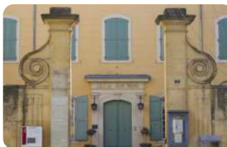
Centre Jean Giono Manosque

L'établissement troglodytique, d'inspiration antique, déploie de vastes secteurs de soins. Des galeries ouvertes sur le parc thermal sont dédiées au repos.