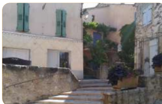
Village Saint Martin de Brômes

Gréoux-les-Bains est la porte d'entrée privilégiée vers le plus grand canyon d'Europe : les Gorges du Verdon.