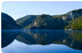
Le Lac d'Esparron-de-Verdon