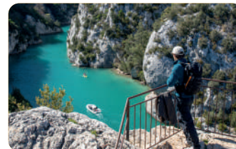
Gorges du Verdon