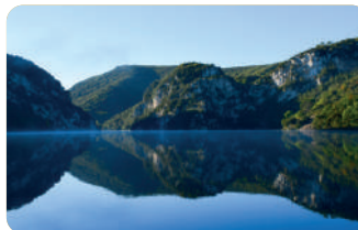
Le Lac d'Esparron-de-Verdon