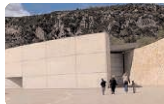
Musée de préhistoire Quinson

Un lieu culturel dédié à la vie et l'œuvre de Jean Giono dans sa ville natale.