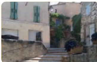
Village Saint Martin de Brômes

Gréoux-les-Bains est la porte d'entrée privilégiée vers le plus grand canyon d'Europe : les Gorges du Verdon.