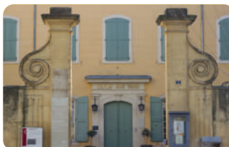
Centre Jean Giono Manosque

L'établissement troglodytique, d'inspiration antique, déploie de vastes secteurs de soins. Des galeries ouvertes sur le parc thermal sont dédiées au repos.